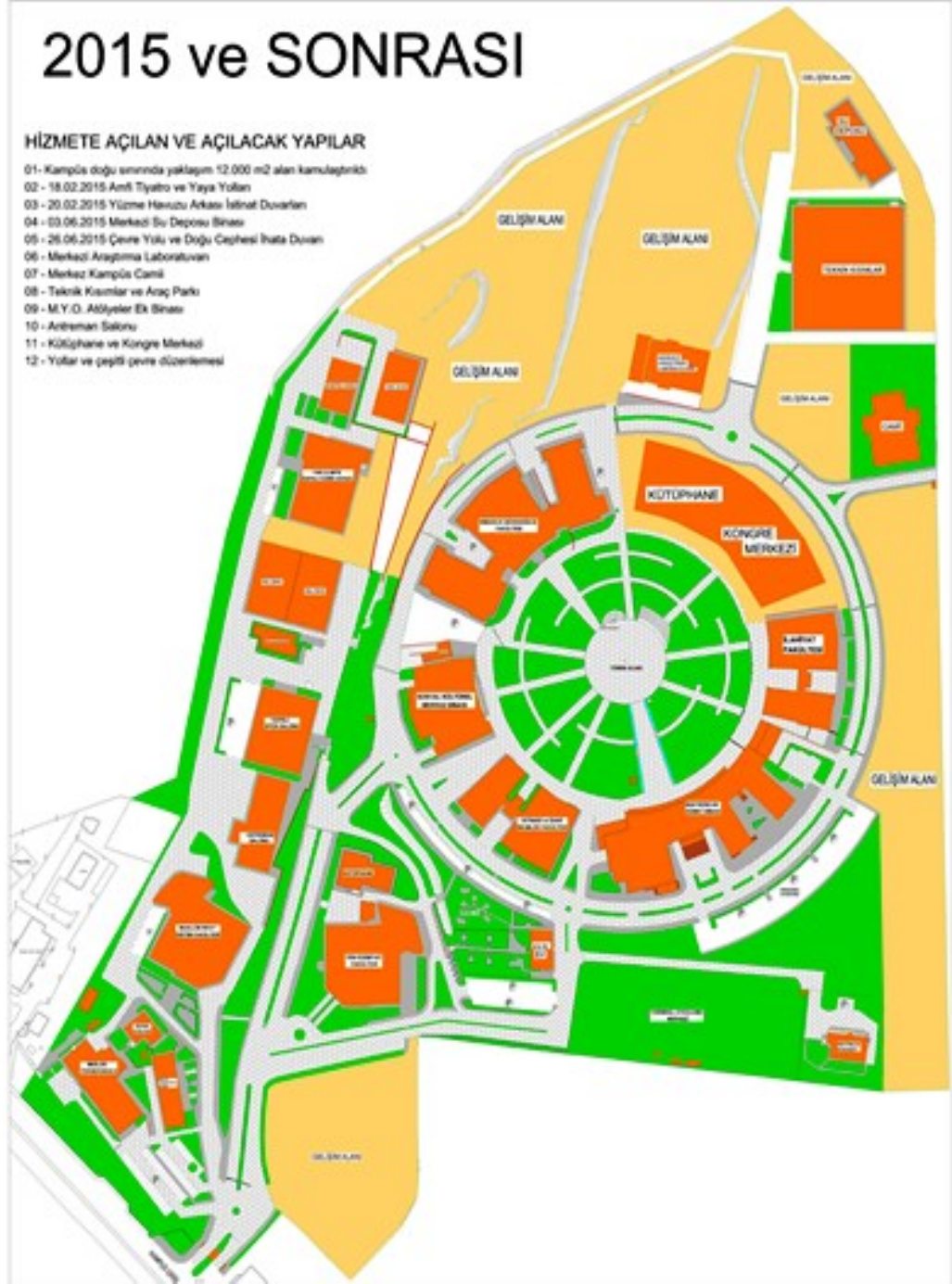
Şekil.1 Kilis 7 Aralık Üniversitesi Kampüs Planı